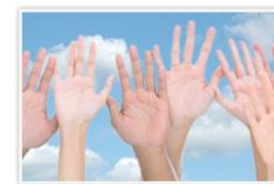
Часто задаваемые вопросы